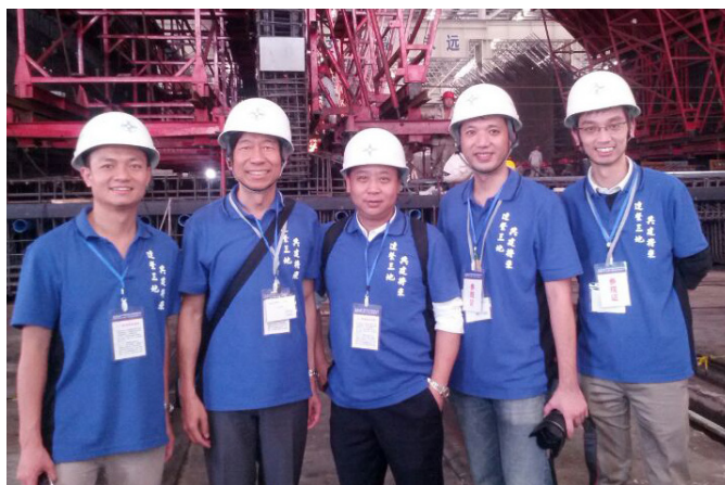
上圖中間者為中聯辦教育科技部葉水球部長

聯會綜合過去兩屆的成功經驗，考察團在今年進一步擴充了專業隊伍，除了工程師外，更有建築師、規劃師、測量師、與業界相關的律師及會計師等。是次活動本會有四名會員參與。他們都對這三日兩夜的行程表示獲益良多，並感到充實及難忘。